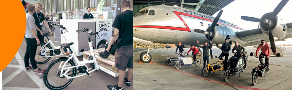
E-Bikes: Steigerung um 125%